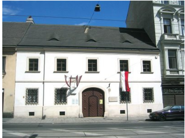
Casa natal de Schubert - Vista frontal