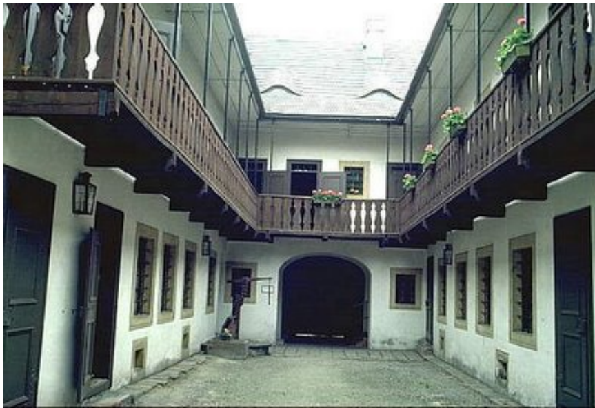
Casa natal de Schubert - Vista Patio Interior