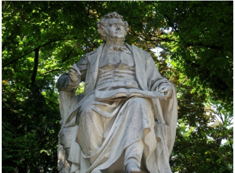
Monumento a Schubert - Viena

▶ En 1818 tiene, aunque sea unos meses, el único trabajo estable de su vida siendo el maestro de música de las hijas del conde Esterhazy en Zelesz.